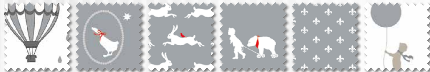
Art. 647700 Col. 40 Art. 647702 Col. 40 Art. 647703 Col. 40 Art. 647704 Col. 40 Art. 647705 Col. 40 Art. 647701 Col. 40