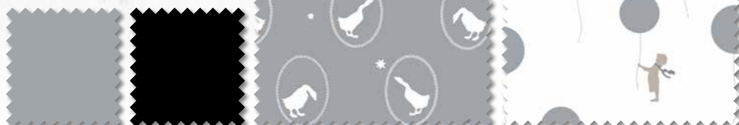
Art. 647000 Col. 40* Art. 647000 Col. 000* Art. 647702 Col. 40 Art. 647701 Col. 40