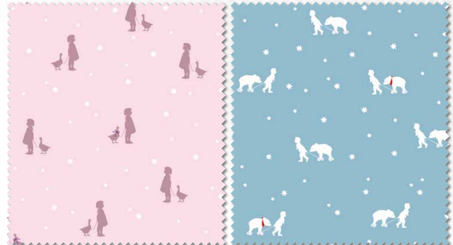
Art. 647706 Col. 320 Art. 647704 Col. 75

Liefereinheit 1 Meter Mindestbestellmenge 6 Meter Lauflänge Stoffballen 6 Meter Breite 145 cm Gewicht 145 g/qm