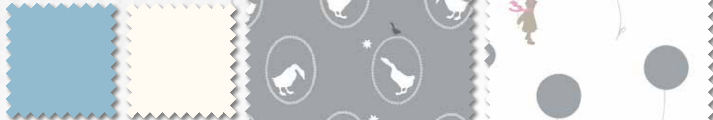
Art. 647000 Col. 276* Art. 647000 Col. 1*