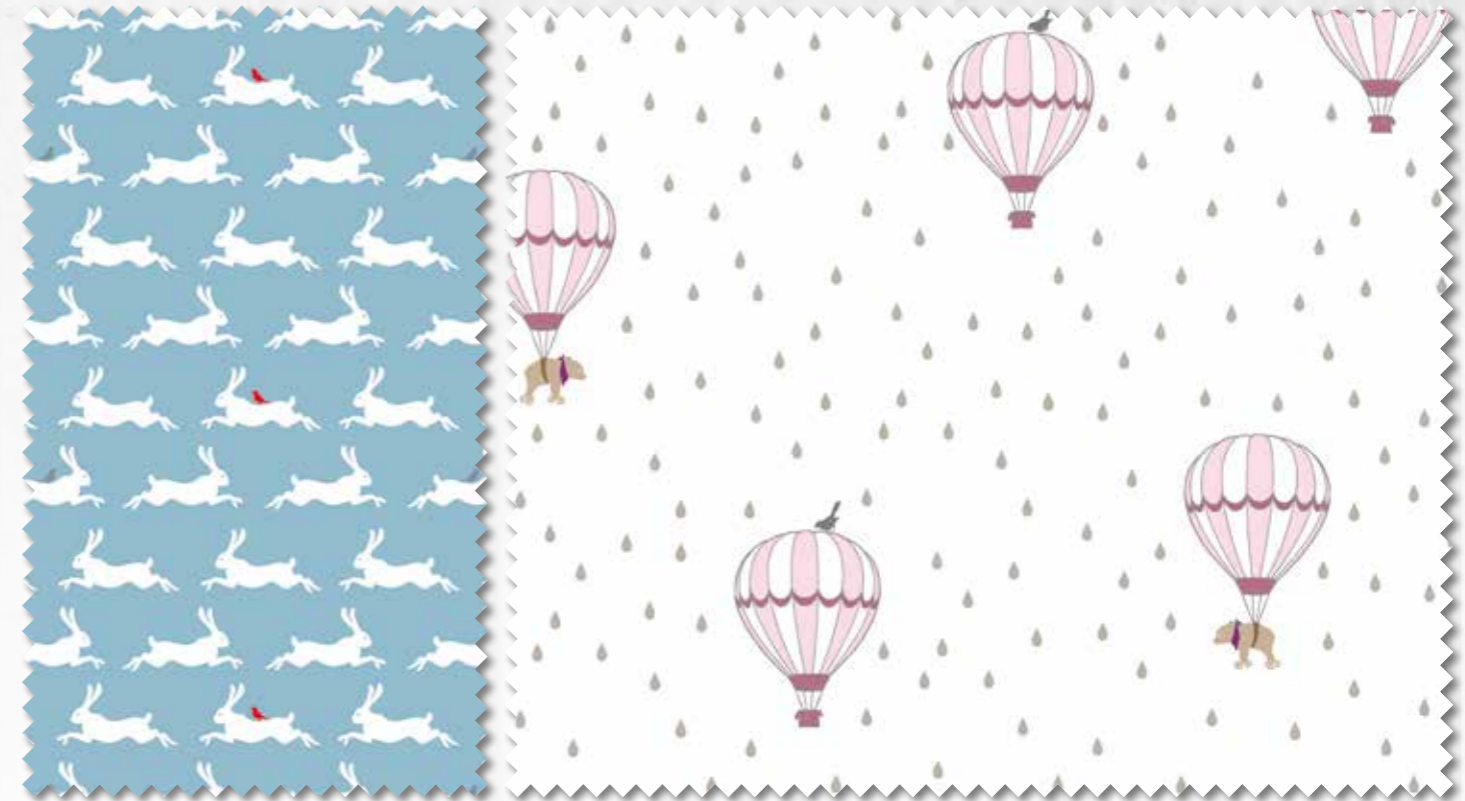
Art. 647703 Col. 75 Art. 647700 Col. 320