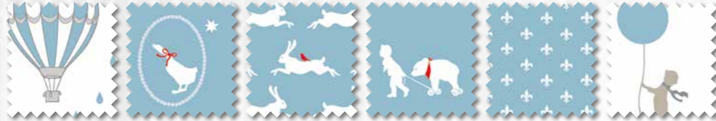
Art. 647700 Col. 75 Art. 647702 Col. 75 Art. 647703 Col. 75 Art. 647704 Col. 75 Art. 647705 Col. 75 Art. 647701 Col. 75