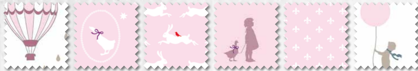
Art. 647700 Col. 320 Art. 647702 Col. 320 Art. 647703 Col. 320 Art. 647706 Col. 320 Art. 647705 Col. 320 Art. 647701 Col. 320