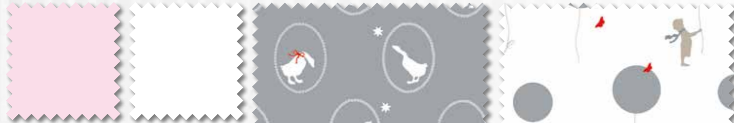
Art. 647000 Col. 320* Art. 647000 Col. 800*